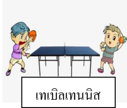
เทเบิลเทนนิส