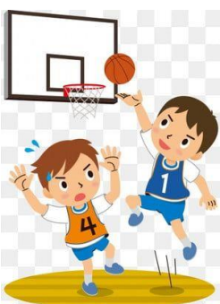
บาสเกตบอล