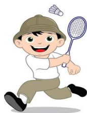
แบดมินตัน