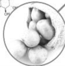
มันฝรั่ง \alpha -solanine, \alpha -chaconine