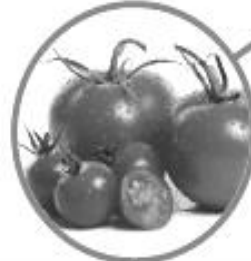
มะเขือเทศ \alpha -tomatine, \alpha -dehydrotomatine