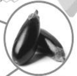
มะเขือม่วง \alpha -solasonine, \alpha -solanargine