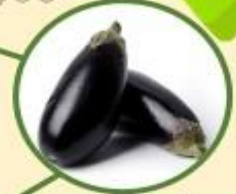
มะเขือม่วง \alpha -solanoside, \alpha -solanone