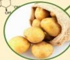
มันฝรั่ง \alpha -solanine, \alpha -chaconine