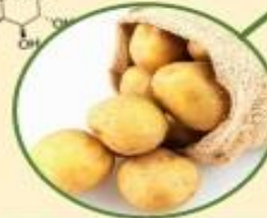
มันฝรั่ง \alpha -solanine, \alpha -chaconine