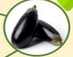
มะเขือม่วง \alpha -solasonine, \alpha -solamargine