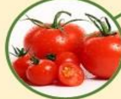
มะเขือเทศ \alpha -tomatine, \alpha -dehydrotomatine